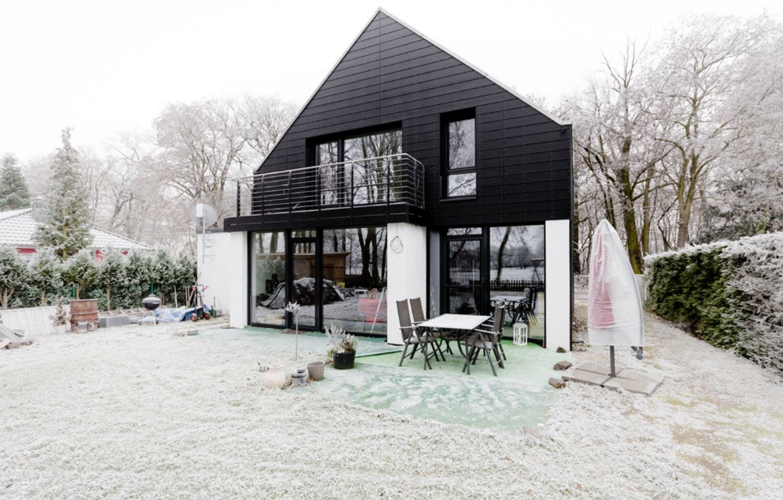
Einfamilienhaus Samswegen | brezinski.ruschak