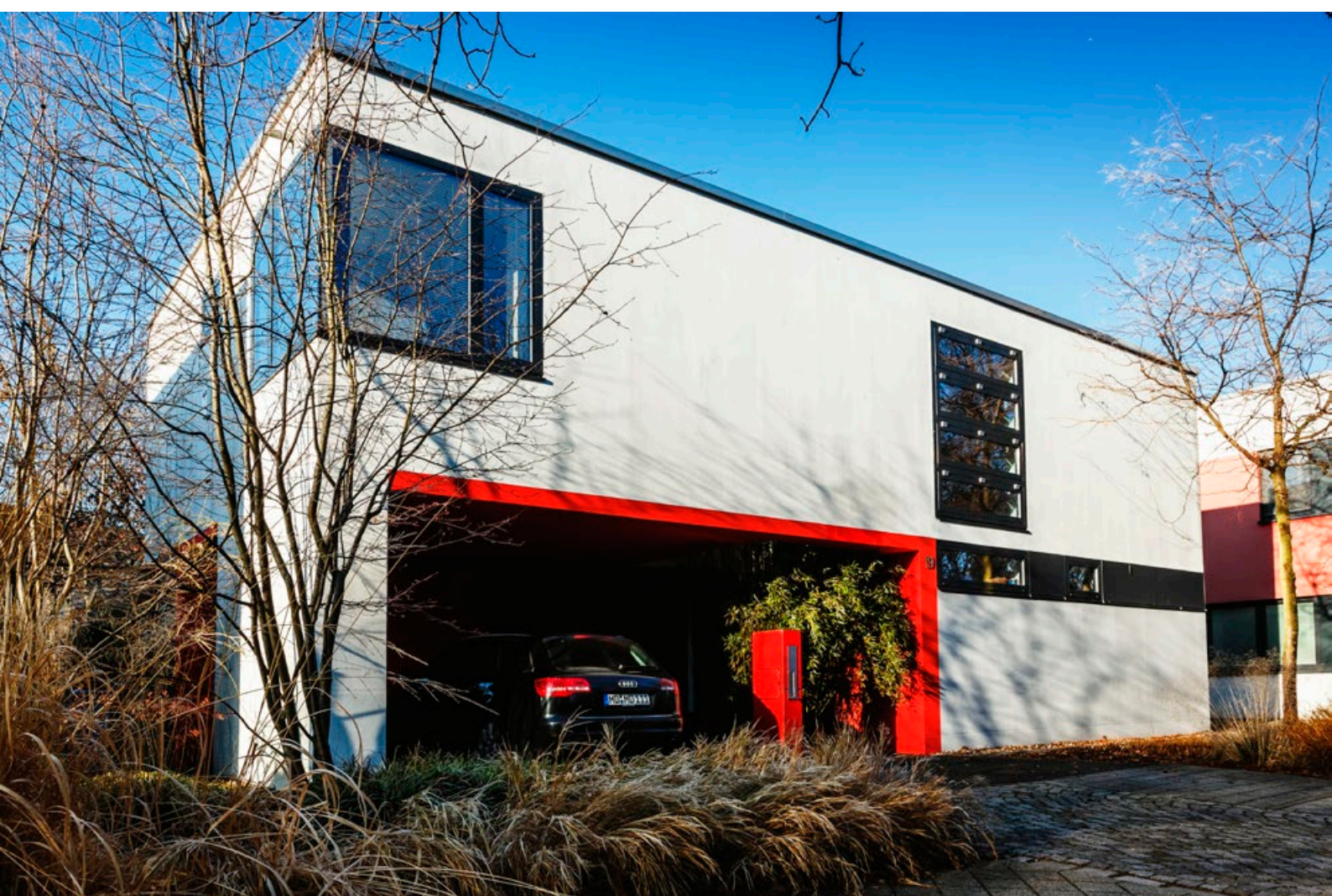
Einfamilienhaus Adelheidring 19 | brezinski.ruschak